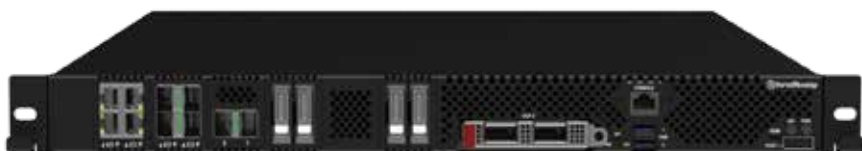
Аппаратная платформа «Рубеж Т» (передняя панель, вариант исполнения №1)

Компания Kraftway представляет доверенную аппаратную платформу «РУБЕЖ», предназначенную для создания на базе российского ПО широкого спектра отечественных сетевых устройств: межсетевых экранов (брандмауэров), шлюзов безопасности, балансировщиков сетевой нагрузки, VPN, устройств фильтрации контента, обнаружения сетевых атак, оптимизации WAN, мониторинга сети и др.