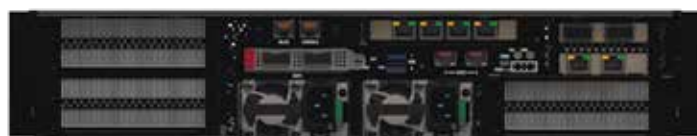
Сервер Kraftway TS3020 (задняя панель)